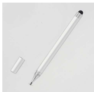
TPAX001SPK (シャイニーピンク)